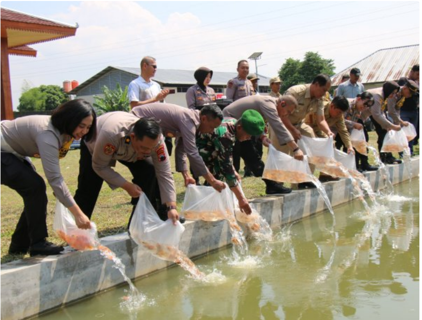
Foto: Polresta Magelang menebar 5.000 benih ikan di kolam Bumdes Desa Mertoyudan dan menanam 60.000 bibit jagung di lahan seluas 6.000 meter persegi di Dusun Kalimalang, Desa Mertoyudan, Kabupaten Magelang.