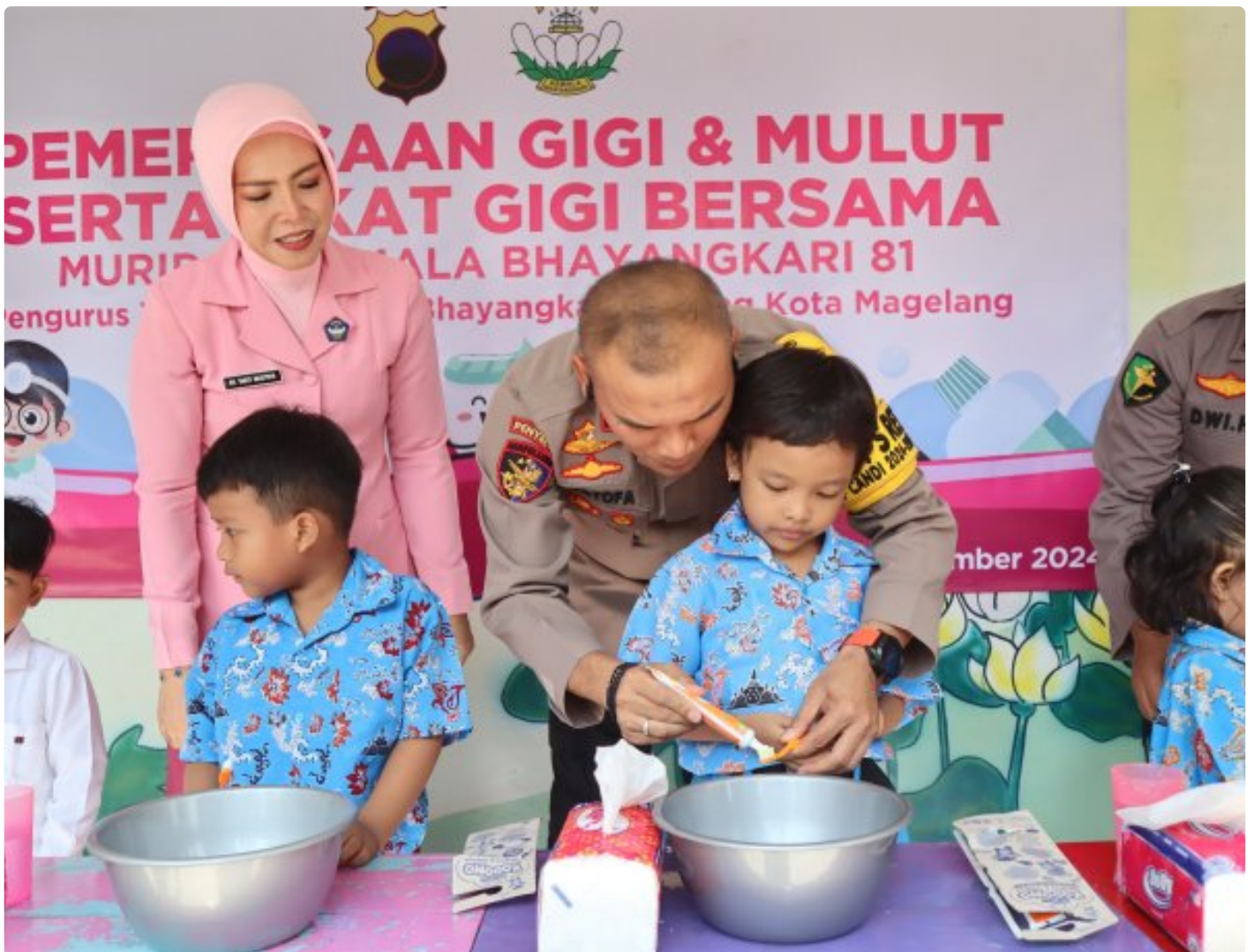
Foto: Bhayangkari Cabang Kota Magelang kembali menunjukkan kepeduliannya terhadap kesehatan anak-anak dengan menggelar Sosialisasi Kesehatan Gigi dan Mulut di TK Kemala Bhayangkari 81 Magelang, Selasa (5/11/2024).